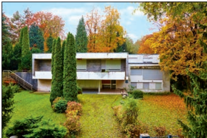
Botschafts-Residenz in Bonn, Im Hag 24 Limit € 765.000, Erlös € 1.100.000

Zum Zeitpunkt des Redaktionsschlusses dieses Geschäftsberichtes sind lediglich die guten Ergebnisse des 1. Quartals und teilweise die Einlieferungsvolumina der Sommerauktionen bekannt. Die Nachfrage nach Immobilien ist ungebrochen, dies zeigen auch die sehr guten Ergebnisse der ersten Auktionen. Trotzdem ist es für eine belastbare Einschätzung des Geschäftsjahres 2017 im Hinblick auf den Objekt- und Courtagumsatz zu früh.