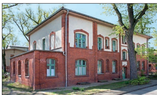
Berlin-Marzahn, Zur Alten Börse 77 Limit € 250.000 Erlös € 370.000

Im zweiten Quartal gab es einen 3,6-%igen Rückgang beim Objektumsatz gegenüber dem Vorjahr auf € 21,4 Mio. Gleichzeitig gelang es aber die Netto-Courtageeinnahmen um 1,6 % im Vergleich zum Vorjahr zu steigern.